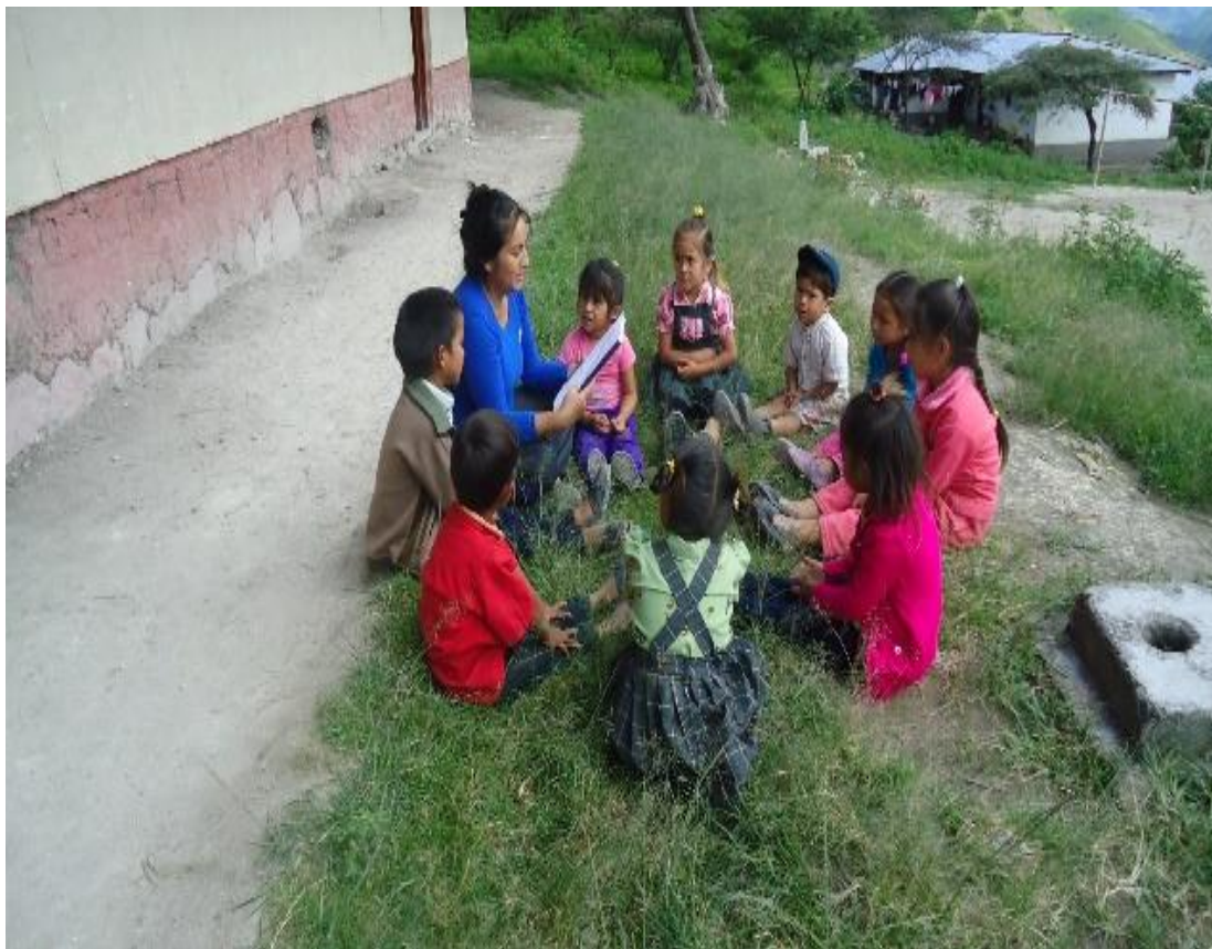
Estudiantes dramatizando el cuento.