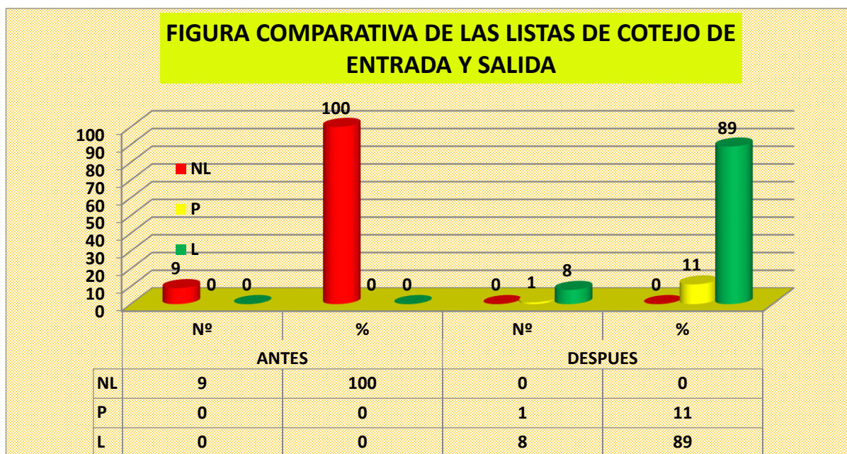
Figura N° 03: Consolidado total de la evaluación de entrada y salida.