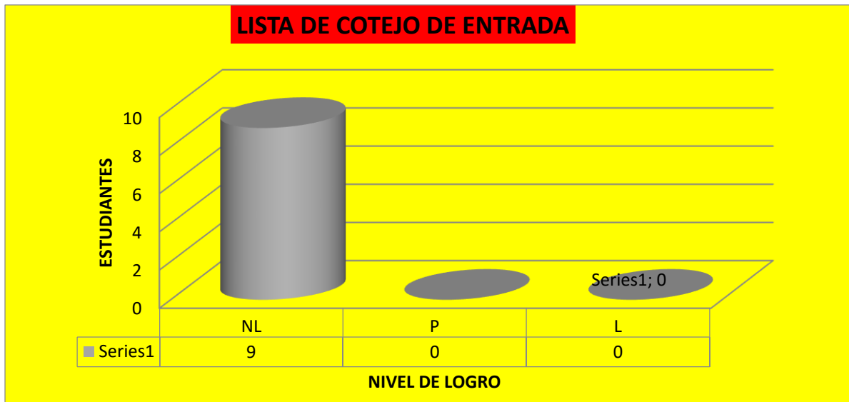
Figura N° 1: Consolidado final de la evaluación de entrada.