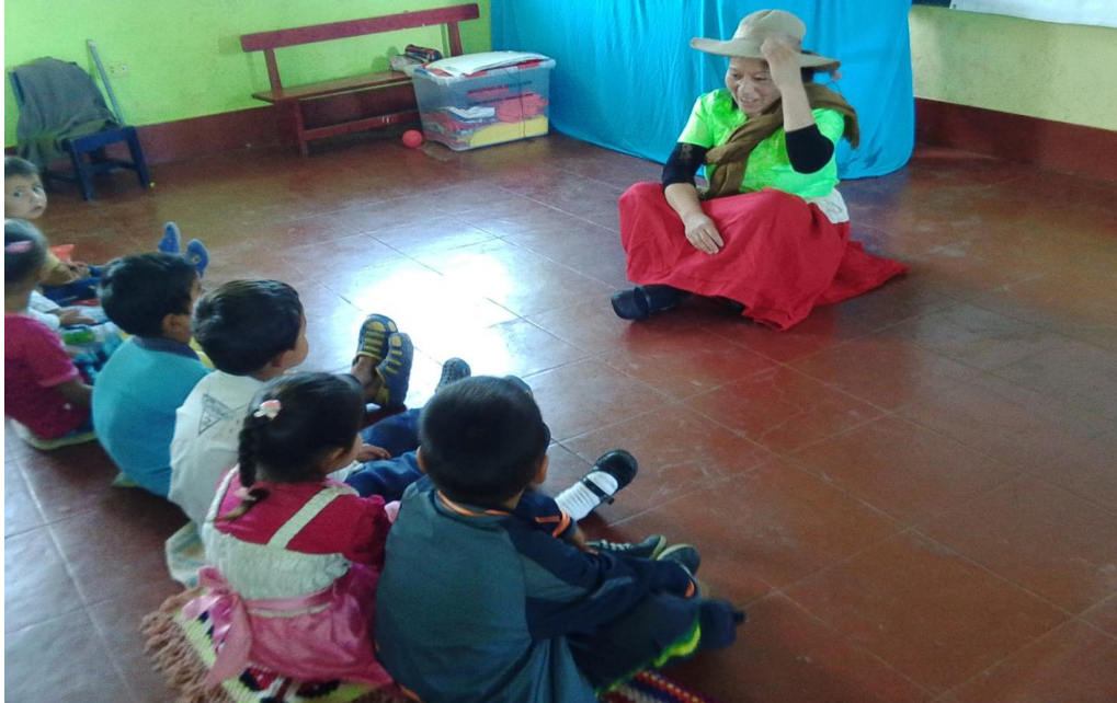
FOTO N° 02: Los niños y niñas eligen el personaje del cuento a representar en la dramatización.