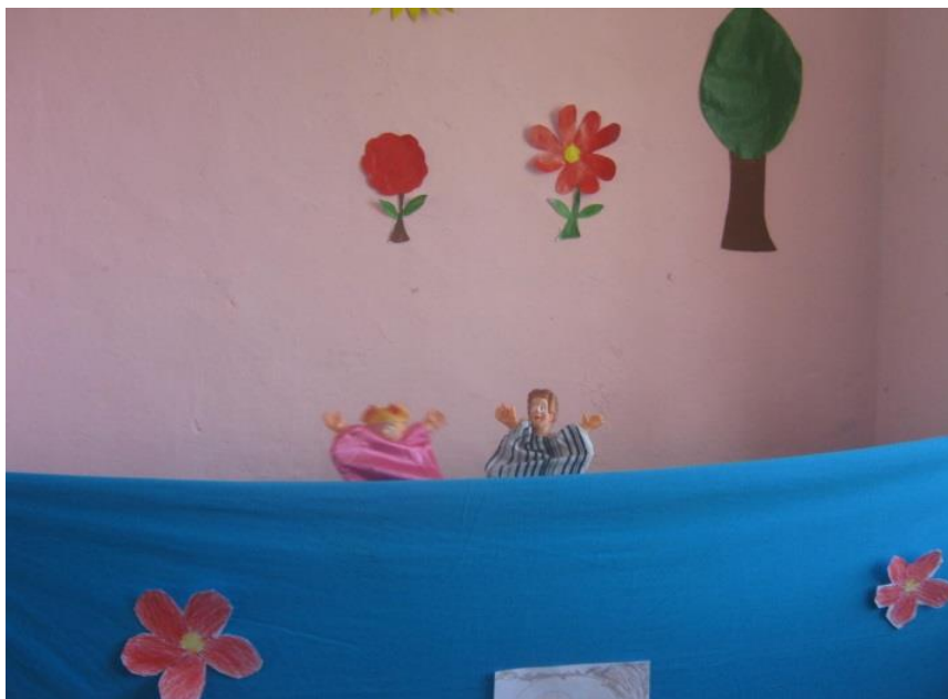
FOTO N° 04: Niños y niñas eligiendo los títeres que desean usar para realizar un festival de títeres.