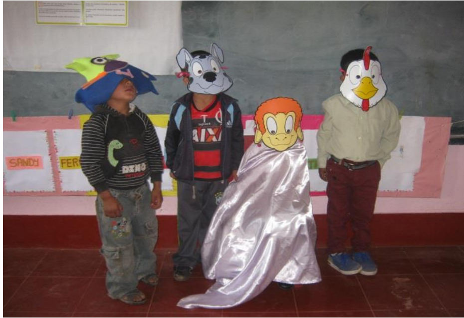
FOTO N° 06: Niño y niñas representando el cuento “Sembramos y vendemos ricas paltas”