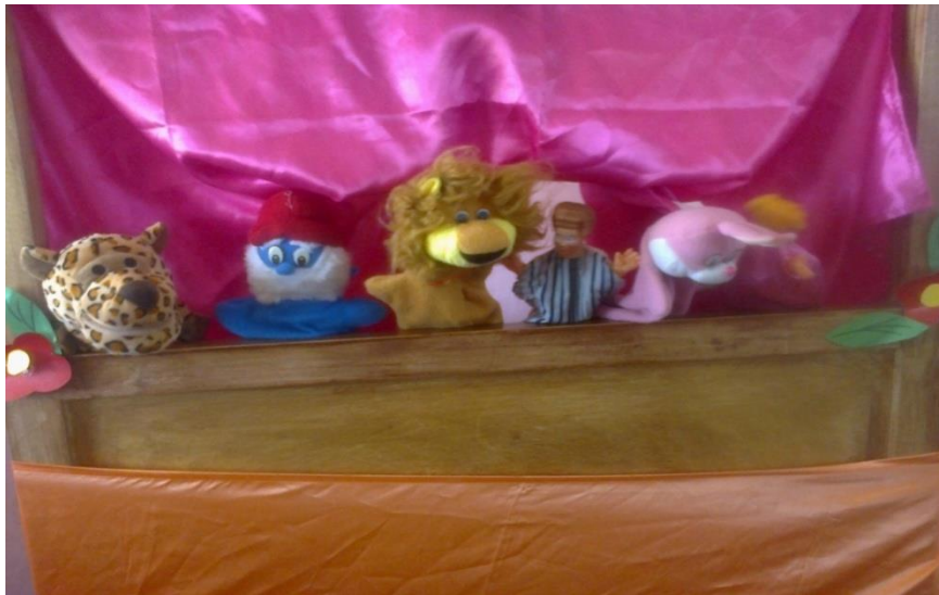
FOTO N° 06: Los niños y niñas utilizan títeres de dedo para dramatizar un cuento creado por ellos