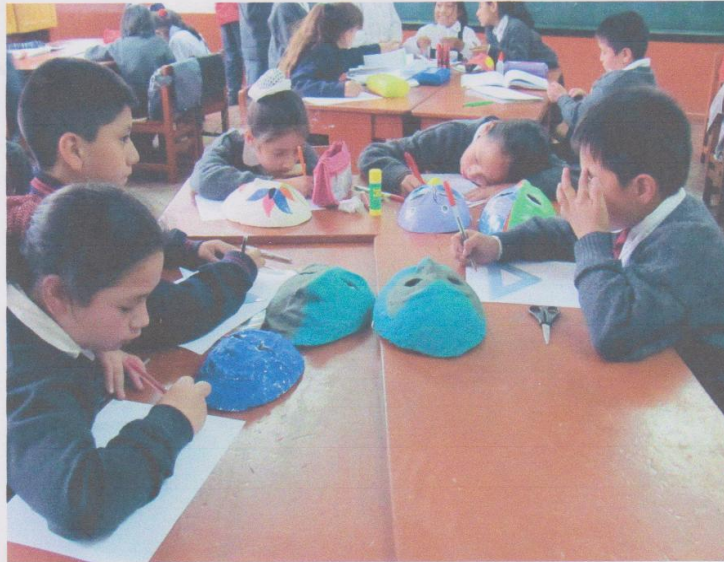
PRODUCIENDO SUS CUENTOS CON SUS MÁSCARAS

Estudiantes realizando sus producciones para luego narrarlas