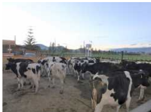
Fig. 4. Establo Los Alpes