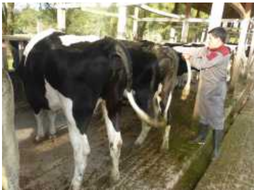
Fig. 1. Establo Tartar - UNC