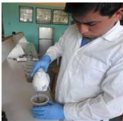
Fig. 8. Homogenizando la muestra