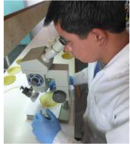
Fig. 13. Diagnóstico de la muestra