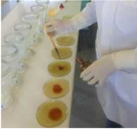
Fig. 12. Colocando lugol parasitológico