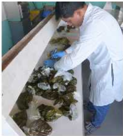
Fig. 6. Codificación de muestras de heces