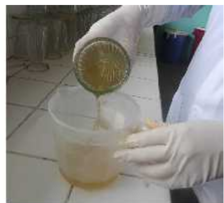
Fig. 11. Decantación de la muestra