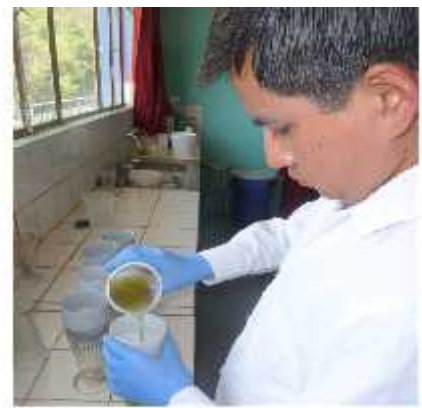
Fig. 9. Colando la muestra