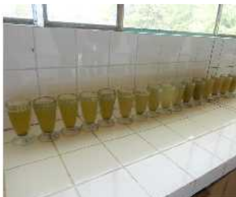
Fig. 10. Sedimentando la muestra