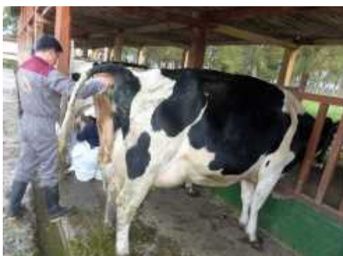
Fig. 5. Extracción de muestra de heces