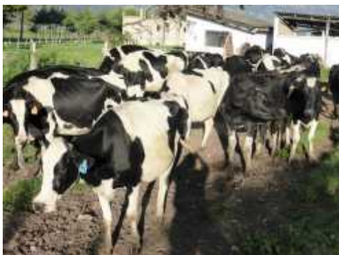
Fig. 3. Establo La Victoria - UNC