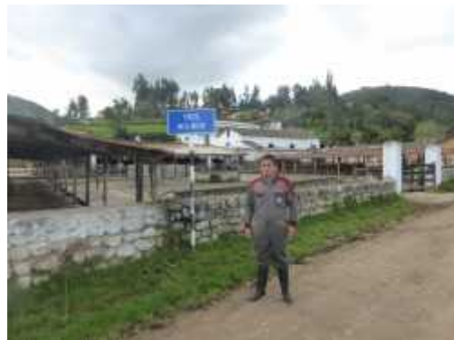
Fig. 2. Establo Tres Molinos