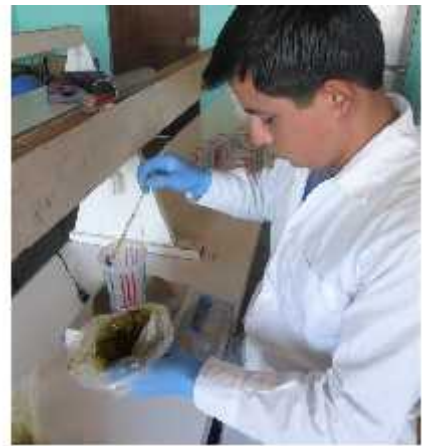
Fig. 7. Pesando 1g de heces