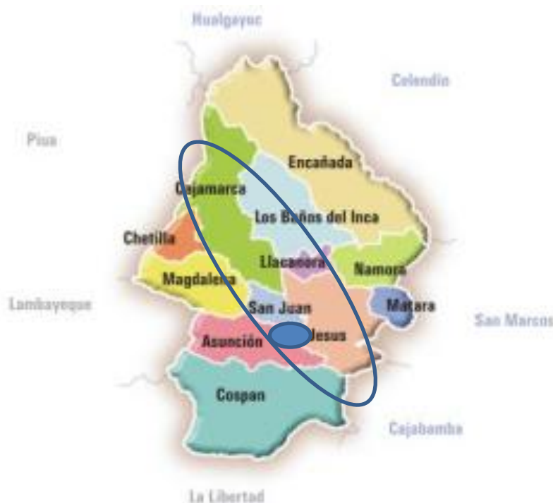
Fig.3 Mapa distrital de la Provincia de Cajamarca

La presente investigación, se llevó a cabo en 04 municipalidades de los distritos de: Jesús, Llacanora, Cajamarca y Baños del Inca; provincia y departamento de Cajamarca durante el año 2017.