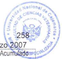
Cuadro 25.1: Consolidado de actividades realizadas en el mes de marzo 2007