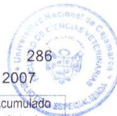
Cuadro 28.1: Consolidado de actividades realizadas en el mes de junio 2007