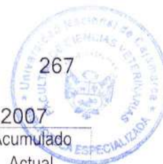
Cuadro 26.1: Consolidado de actividades realizadas en el mes de abril 2007