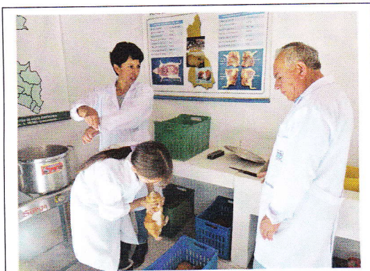
Fig 7. Sacrificio de cuyes.