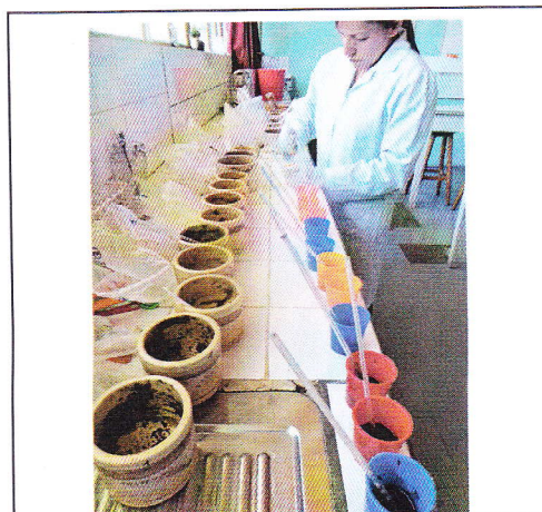
Fig 14. Homogenizando la muestra.