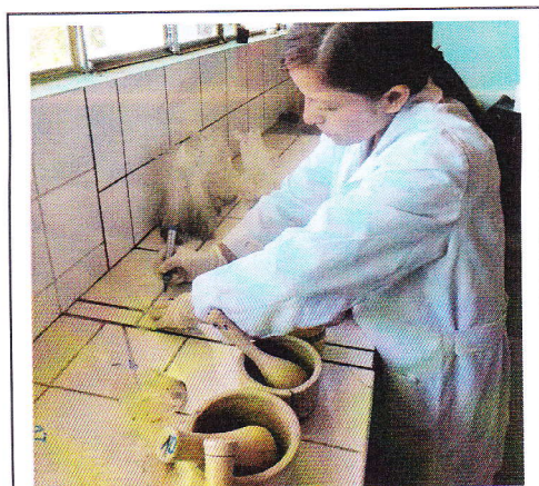
Fig 12. Codificación de muestras de heces.