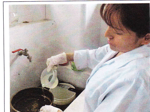
Fig 10. Uso de tamiz para colecta de nematodos.