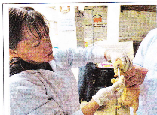
Fig 6. Dosificación oral.