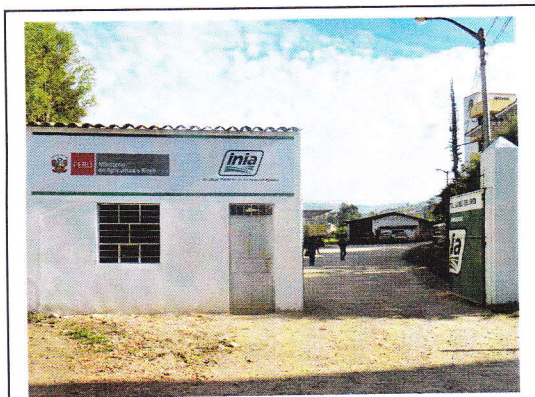
Fig 1. Estación Experimental Baños del Inca. INIA.