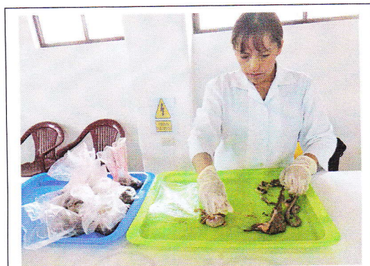
Fig 9. Separación de ciego y colon.