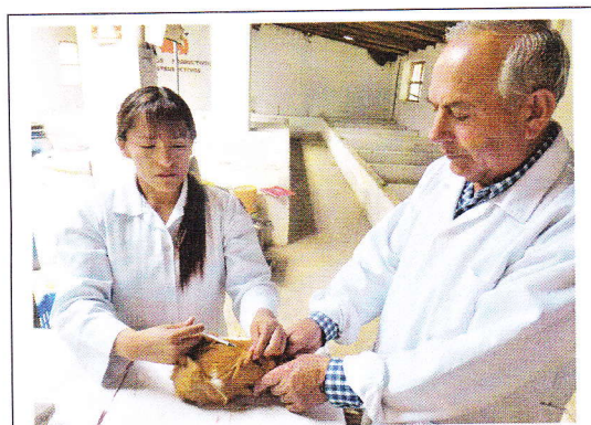
Fig 5. Dosificación subcutánea.