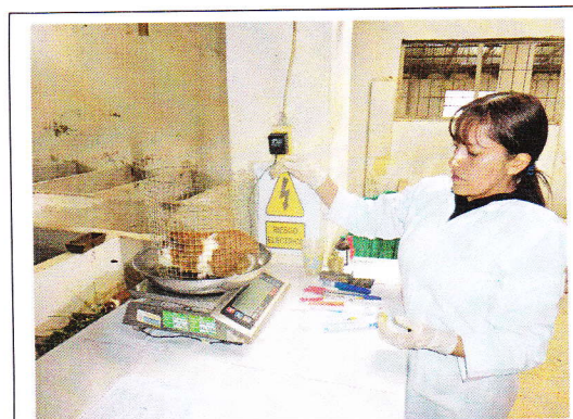
Fig 4. Pesaje de cuyes.