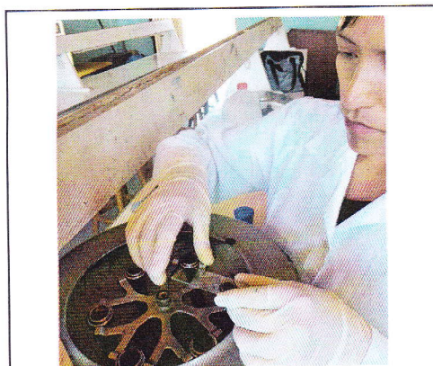
Fig 16. Centrifugando la muestra.