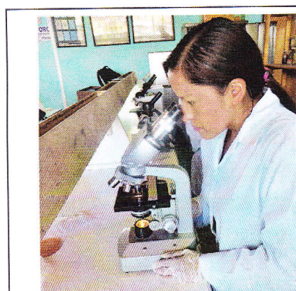
Fig 17. Diagnóstico.