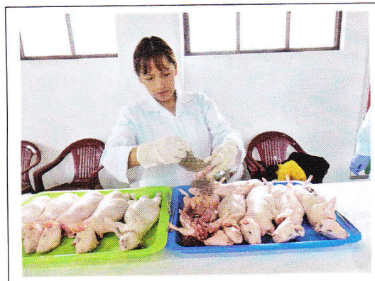
Fig 8. Necropsia para obtención de vísceras.