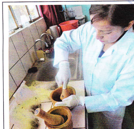
Fig 13. Trituración de heces en mortero.