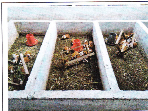
Fig 2. Material biológico.