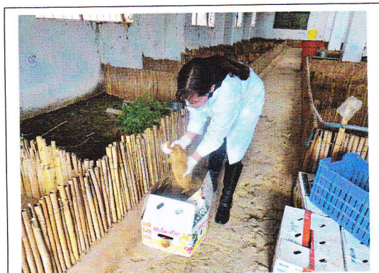
Fig 3. Encierro de cuyes para coleccionar heces.