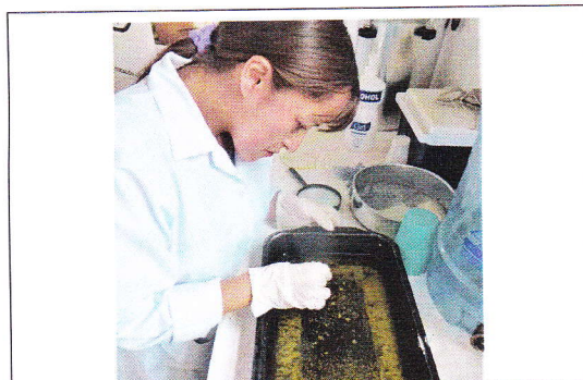
Fig 11. Colecta y conteo de nematodos.