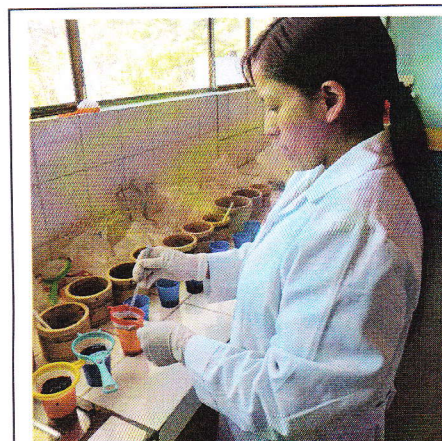
Fig 15. Filtrando la muestra.