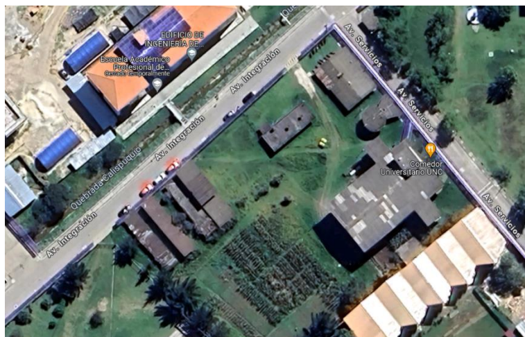
Figura 01: Lugar de ubicación del estudio

El Lugar de la ejecución (ubicación) del estudio se muestra en la figura 01: