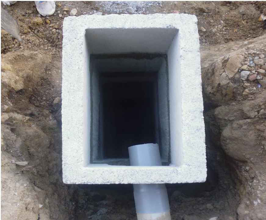
Figura 10. Caja de desagüe instalada.