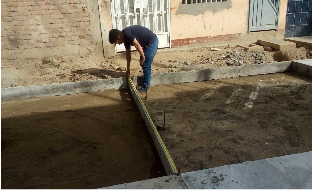
Figura 13. Medición de paño de pavimento L=3.50\text{m} ( e=0.20\text{m} ).