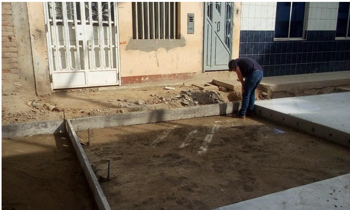
Figura 12. Medición de paño de pavimento L=3.50\text{m} ( e=0.20\text{m} ).