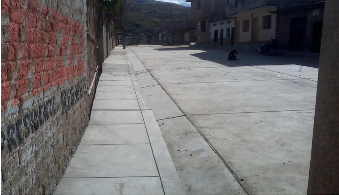
Figura 9. Concreto de veredas f'c= 175 \text{ kg/cm}^2 .