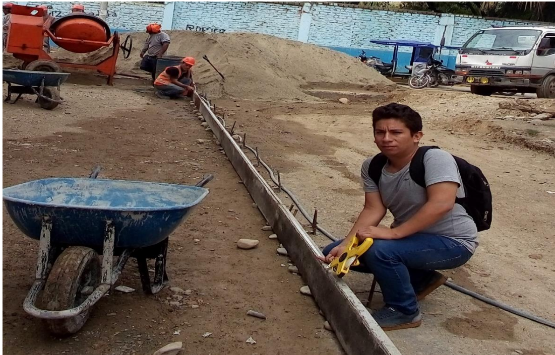
Figura 11. Medición de encofrado de pavimento ( e=0.20\text{m} )