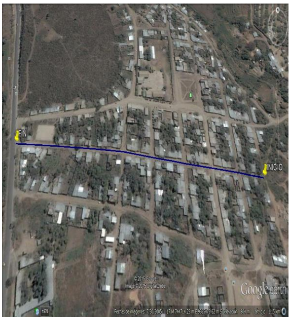
Figura 1. Ubicación y localización del proyecto.