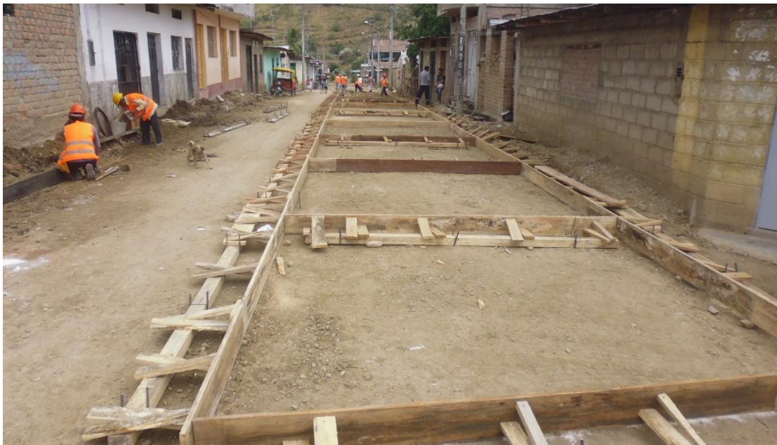
Figura 6. Encofrado para pavimento ( e = 0.20 m).