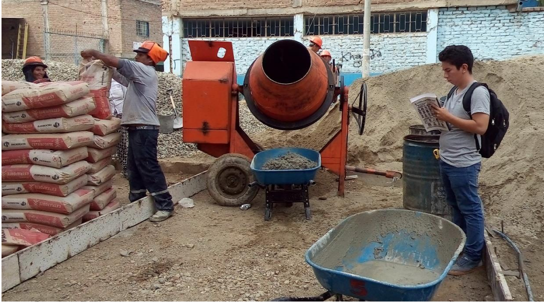
Figura 5. Verificación de cuadrilla y control del tiempo antes del vaciado.