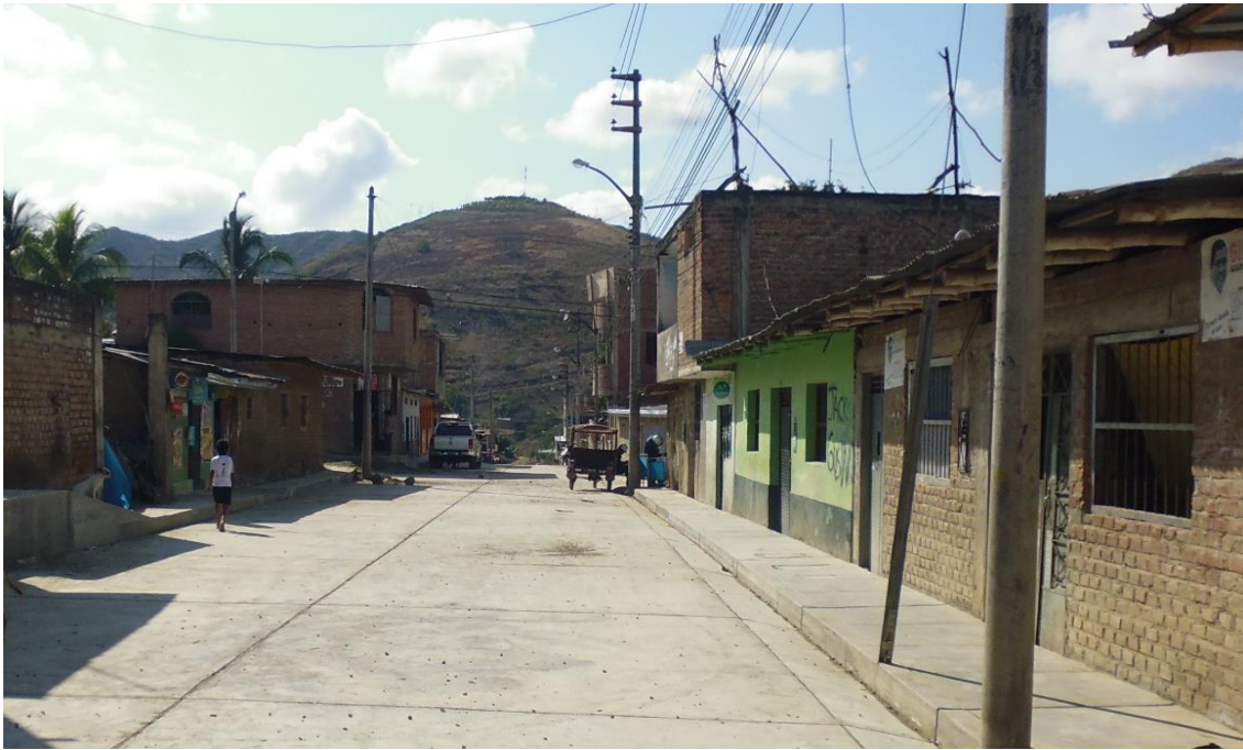
Figura 7. Cunetas de concreto f'c=175\text{ kg/cm}^2 .