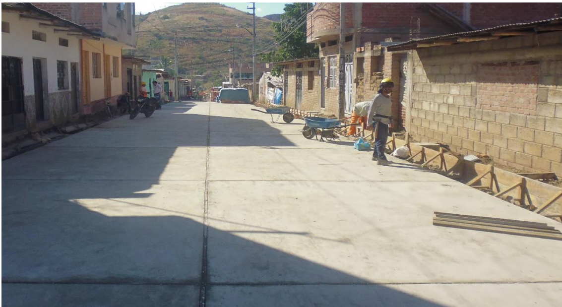
Figura 8. Encofrado de veredas ( e=0.15\text{m} ).