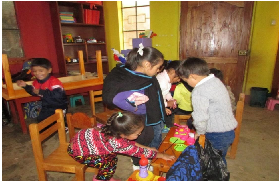
ESTUDIANTES EJECUTANDO ACTIVIDADES QUE REALIZA MAMÁ EN CASA