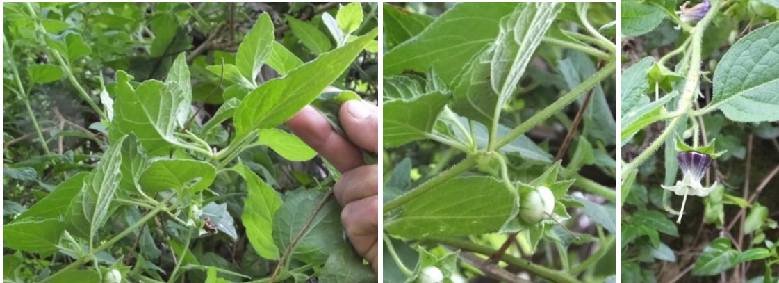
Figura 58. Planta: Ayaj longosh.

Usos. Se emplea los frutos para bajar el peso de las personas, por ser ácido.