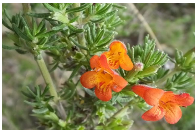
Figura 46. Planta: Satureja sericea .