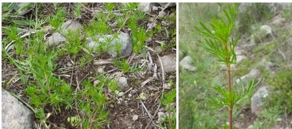
Figura 40. Planta: Tagetes filifolia .