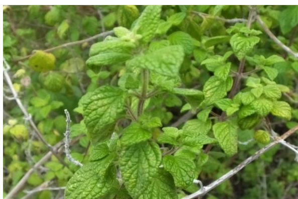
Figura 47. Planta: Minthostachys sp.

Precauciones. En exceso no se debe dar a los becerros porque puede matarlo, ya que llega a su pulmón y lo ahoga.