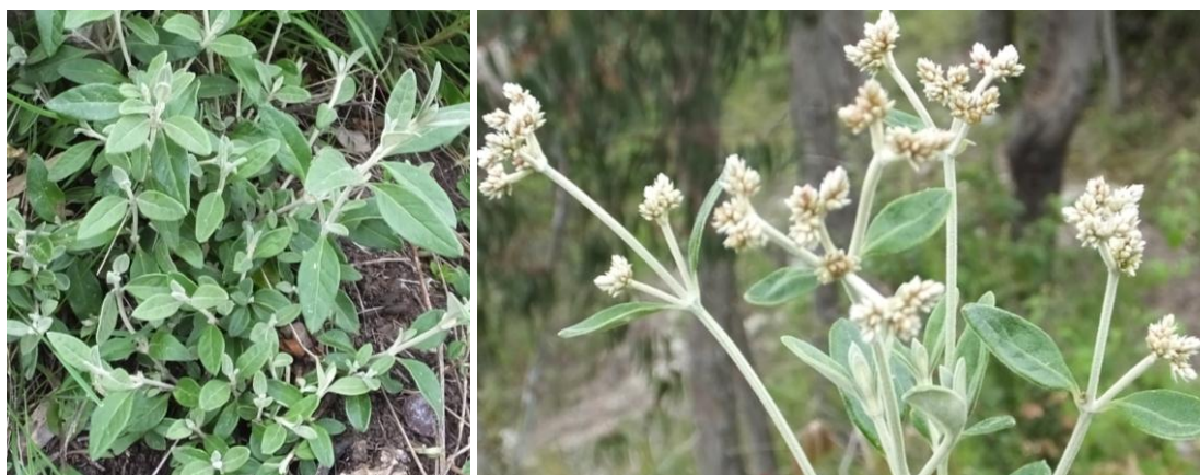
Figura 49. Planta: Alternanthera peruviana .

Precauciones. Debe bañarlo una mujer con ánimo caso contrario puede contagiarse de la chirapa.