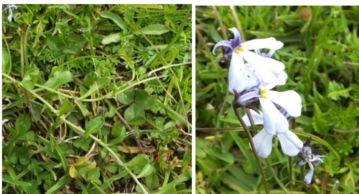
Figura 70. Planta: Lobelia sp.