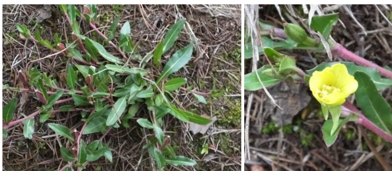
Figura 67. Planta: Oenothera multicaulis .