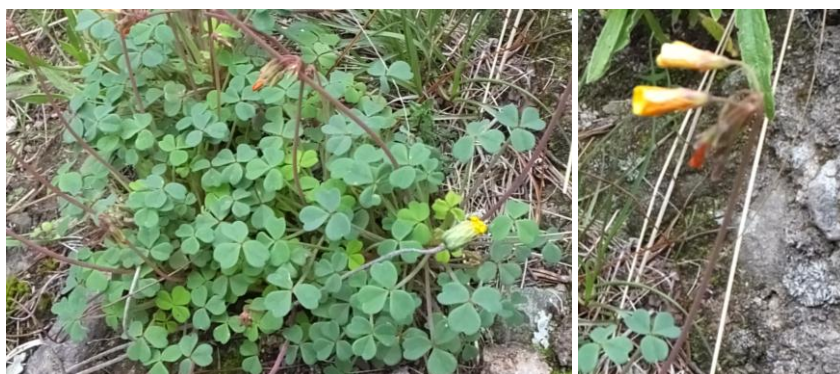
Figura 50. Planta: Oxalis peduncularis .