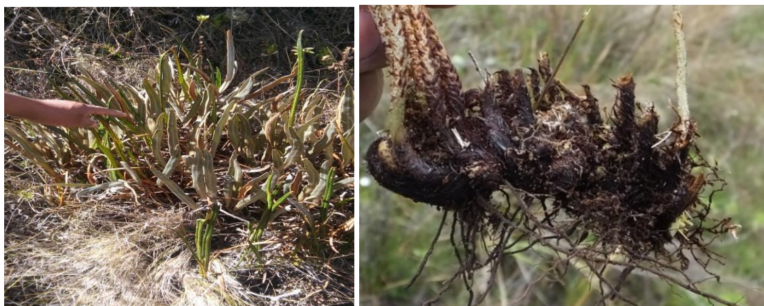
Figura 39. Planta: Elaphoglossum sp.