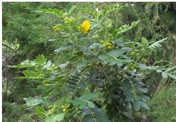
Figura 31. Planta: Senna sp.