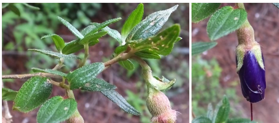
Figura 68. Planta: Miconia sp.