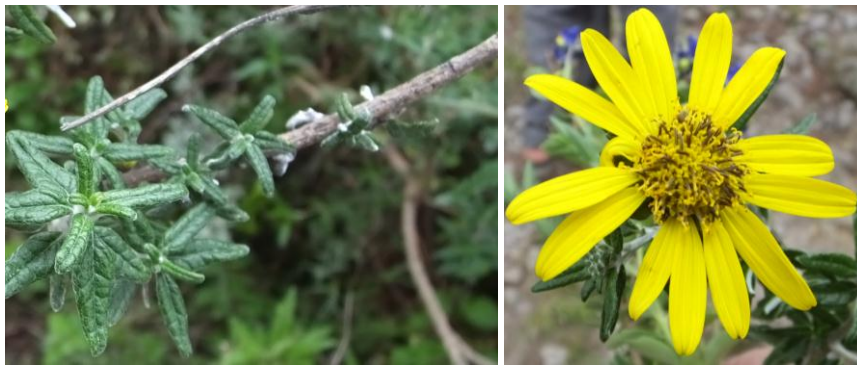
Figura 71. Planta: Helianthopsis sp.

Usos. Es utilizado como escoba para barrer la era en la cosecha de trigo o cebada.