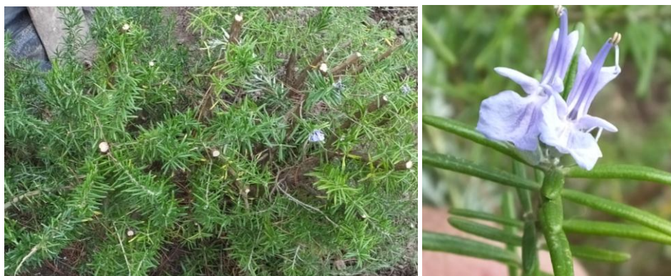
Figura10. Planta: Rosmarinus officinalis .