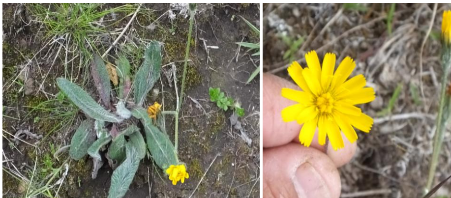
Figura 42. Planta: Hieracium peruanum .