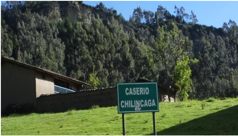
Figura 1. Ingreso al caserío Chilincaga.