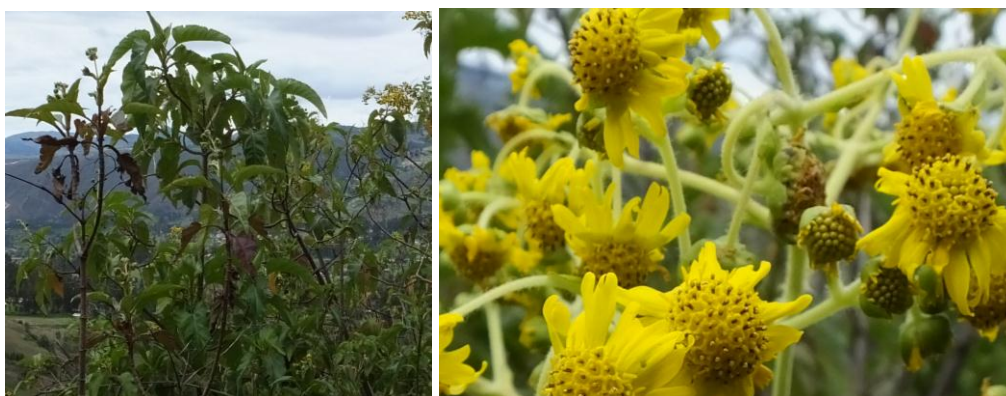
Figura 59. Planta: Smallanthus jelskii .