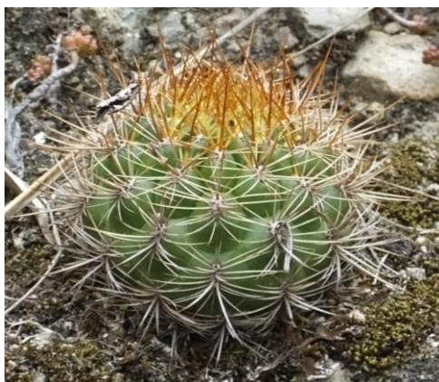
Figura 69. Planta: Matucana sp.

Precauciones. Recoger con un pico y guantes de cuero protegidos las manos ya que cuenta alrededor con espinas, caso contrario puede ser afectado la mano.