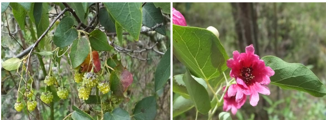
Figura 55. Planta: Vallea stipularis .

Precauciones. Seguir los procedimientos adecuados caso contrario puede cambiar de color esperado.