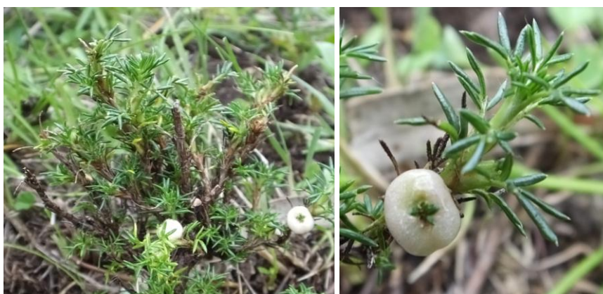
Figura 35. Planta: Margyricarpus pinnatus .