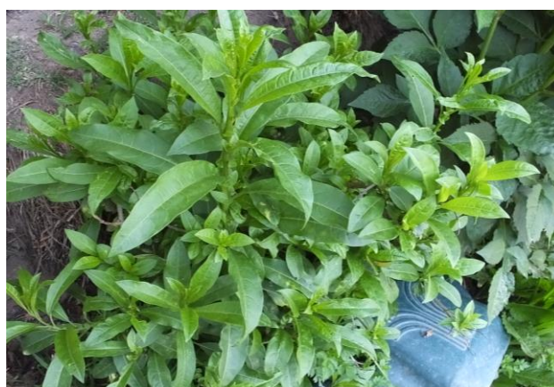
Figura 22. Planta: Cestrum auriculatum .