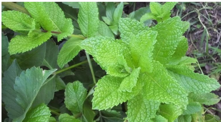
Figura 9. Planta: Mentha sativa .

Precauciones. En exceso el consumo en sopa nos despalaga.