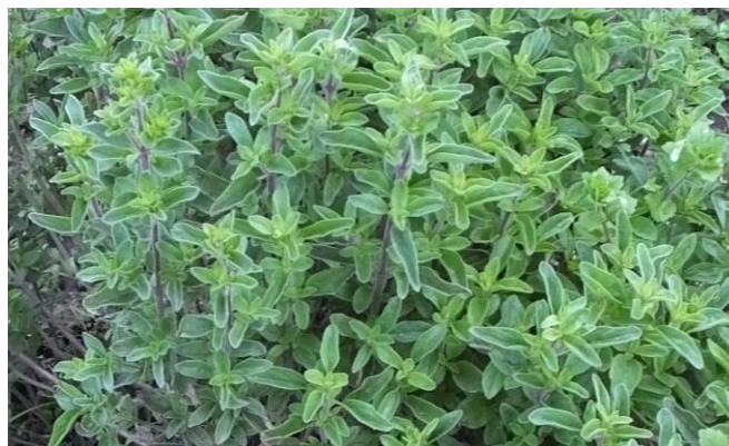
Figura 6. Origanum vulgare .

Precauciones. En exceso puede ser abortivo para las mujeres embarazadas.