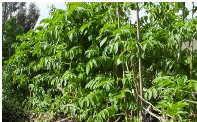
Figura 21. Planta: Sambucus peruviana .