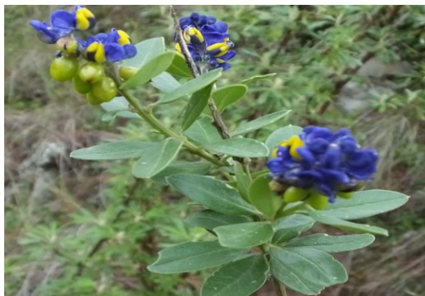
Figura 54. Planta: Monina salicifolia .