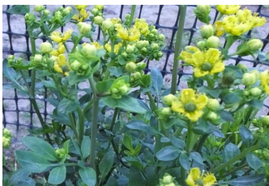
Figura 11. Planta: Ruta graveolens .

Precauciones. No debe consumir las mujeres embarazadas ya que es abortiva.