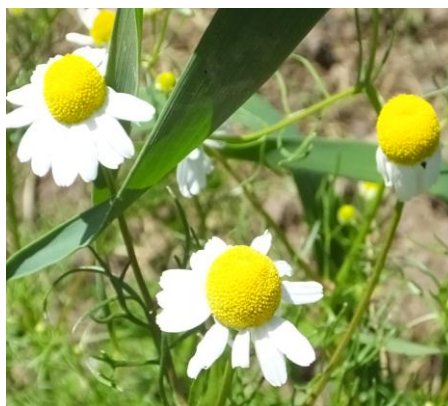
Figura 4. Planta: Matricaria chamomilla .