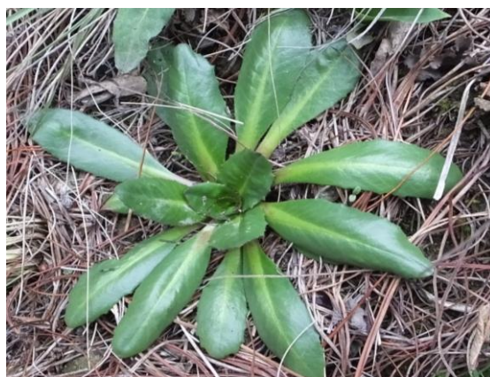
Figura 19. Planta: Hypochaeris taraxacoides .