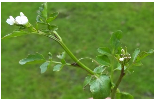
Figura 20. Planta: Rorippa nasturtium – aquaticum .