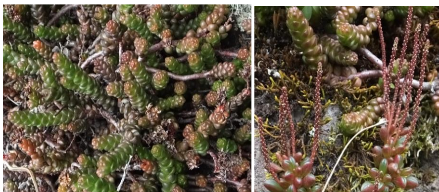
Figura 61. Planta: Peperomia sp.