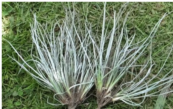
Figura 60. Planta: Plantago sericea .