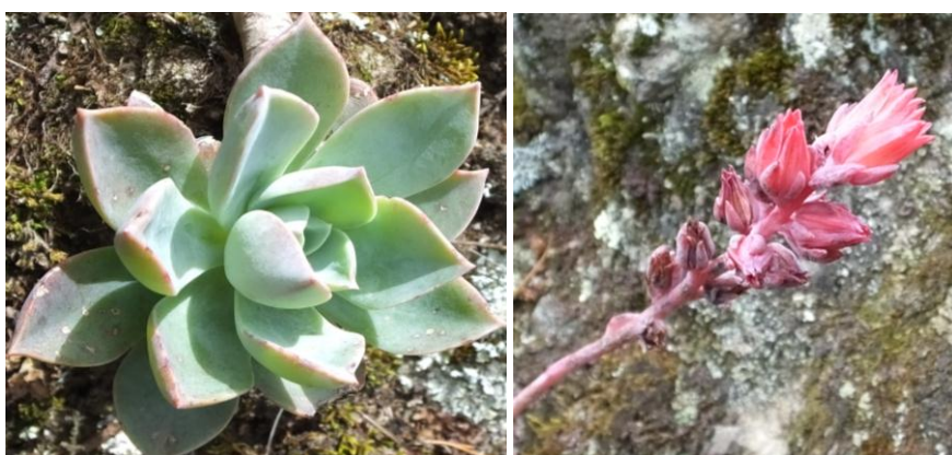
Figura 43. Planta: Echeveria sp.