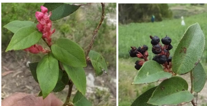
Figura 72. Planta: Gaultheria erecta .