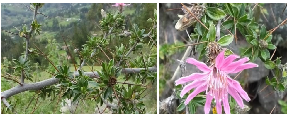
Figura 77. Planta: Barnadesia dombeyana .

Precauciones. Recoger con mucho cuidado ya que tiene espinas, que puede picar a las manos.