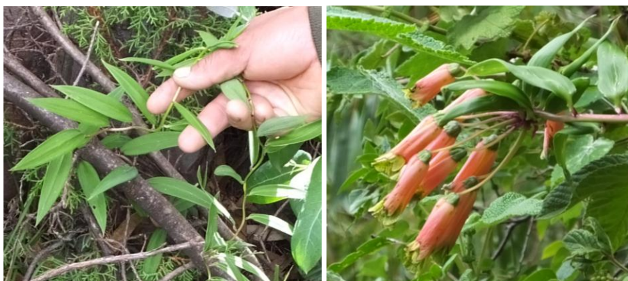
Figura 76. Planta: Bomarea sp.

Precauciones. Es una planta peligrosa, no debe coger una mujer a la planta ya que puede quebrar la olla de tierra en la cocina es una crencia del campesino en algunos casos puede darse o en otras no.