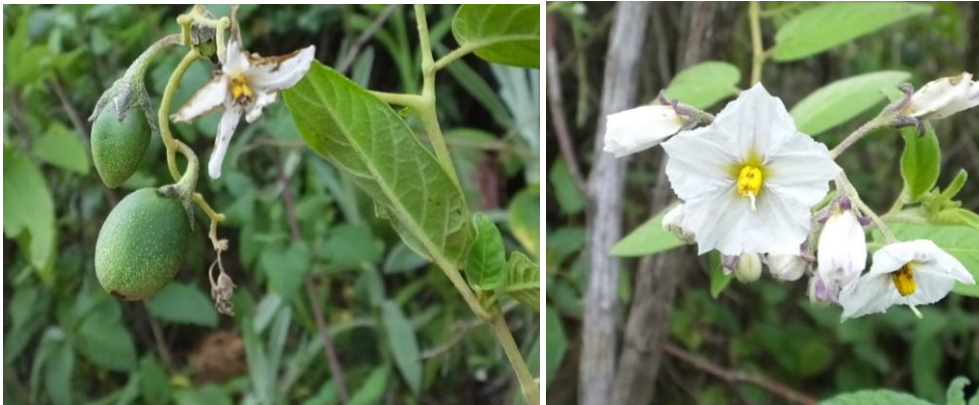
Figura 56. Planta: Longosh.

Usos. Se emplea los frutos para bajar el peso de las personas, por ser ácido.