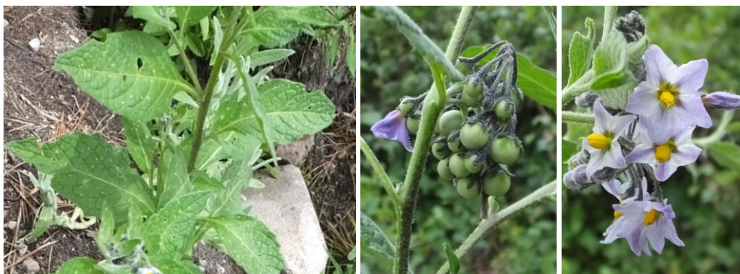
Figura 57. Planta: Solanum nigrum .