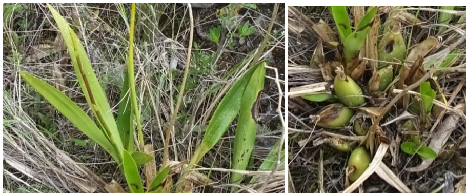
Figura 32. Planta: Oncidium sp.