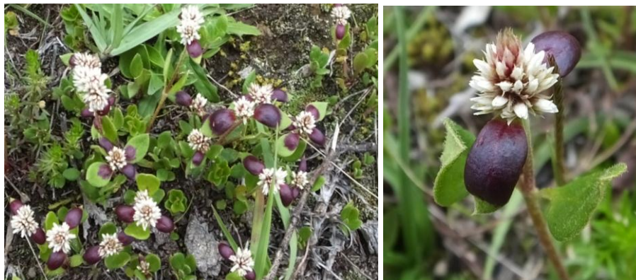
Figura 79. Planta: Alternanthera macbridei .