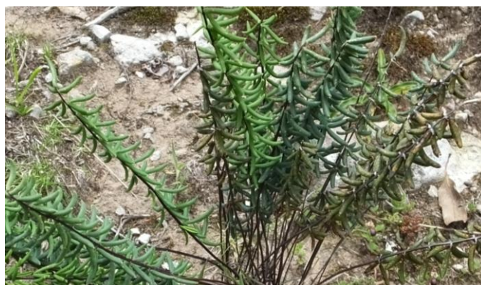
Figura 63. Planta: Pellaea ternifolia .