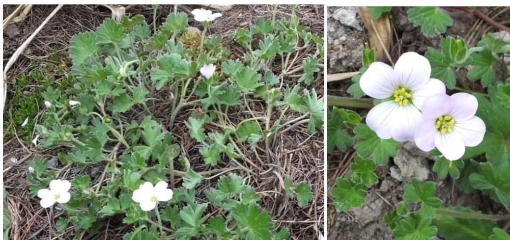
Figura 45. Planta: Geranium ruizzii .