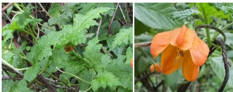
Figura 74. Planta: Cajophora sp.