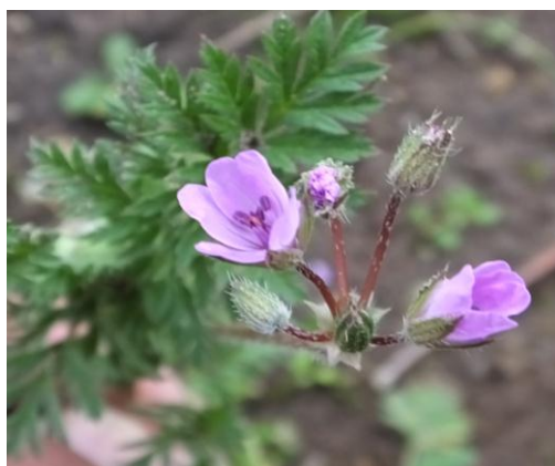
Figura 73. Planta: Erodium cicutarium .