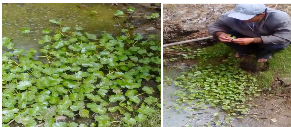
Figura 18. Planta: Hydrocotyle sp.