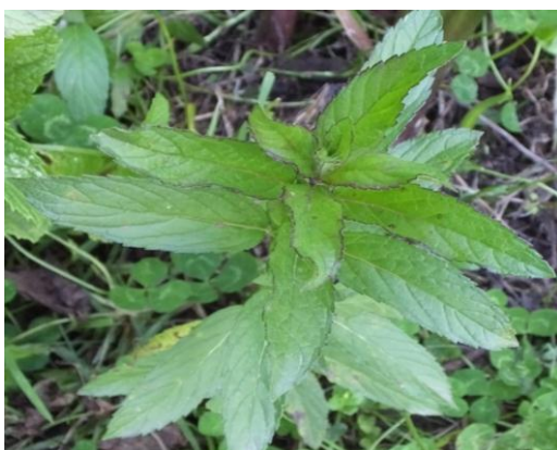
Figura 8. Planta: Mentha piperata