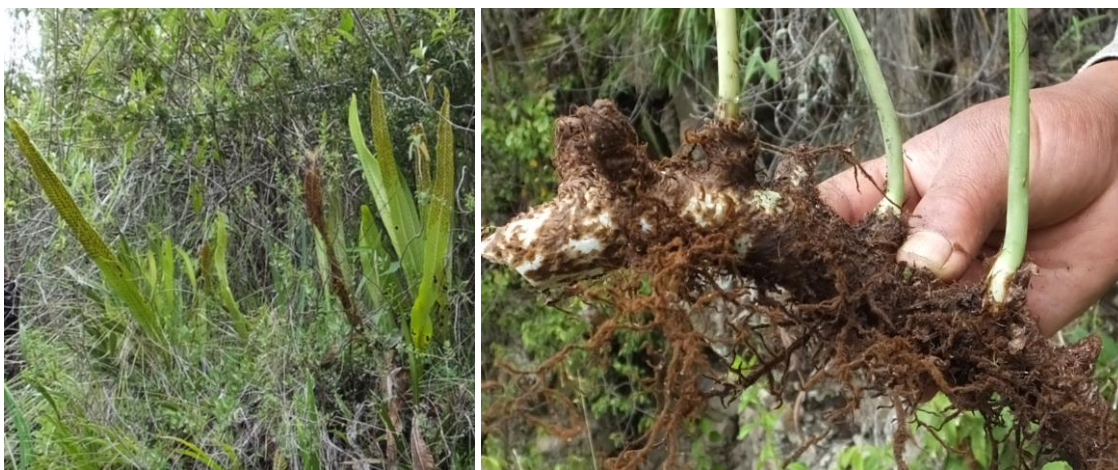
Figura 38. Planta: Niphidium crassifolium .