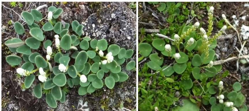
Figura 62. Planta: Peperomia parvifolia .