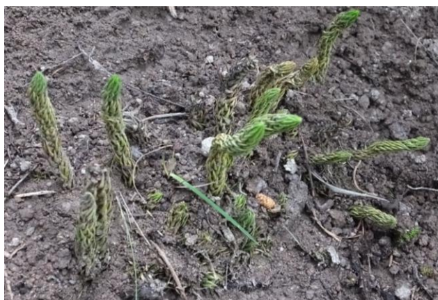
Figura 33. Planta: Huperzia crassa .

Precauciones. A la persona que se le dió el remedio se debe cuidar por 5 días y solamente debe verlo o atenderlo una sola persona, caso contrario puede alocarse e irse de su casa sin destino.