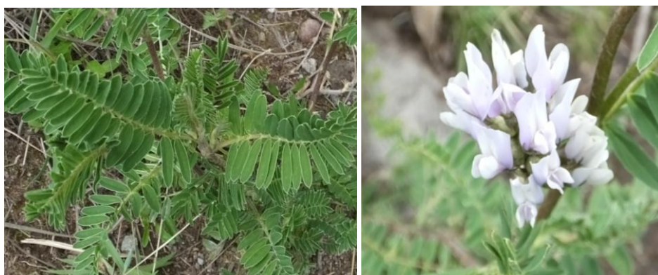
Figura 78. Planta: Astragalus garbancillo .