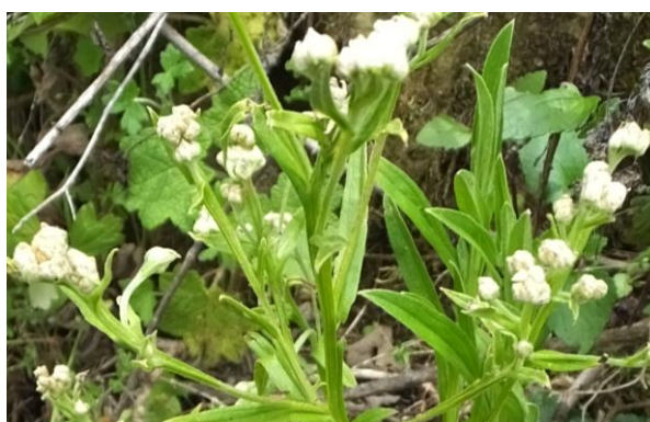
Figura 41. Planta: Achyrocline alata .