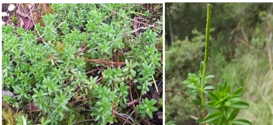
Figura 34. Planta: Peperomia microphilla .

Precauciones. El consumo en exceso, puede causar que las personas pueden olvidarse de su vida diaria (trabajo, sus hijos, etc).