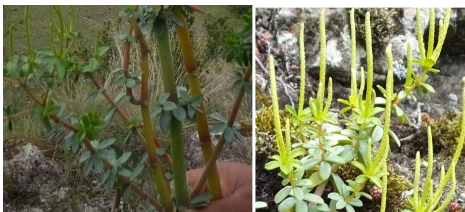
Figura 36. Planta: Peperomia hartwegiana .

Precauciones. No debe coger los niños de menor edad porque pueden olvidarse de sus estudios u otros.