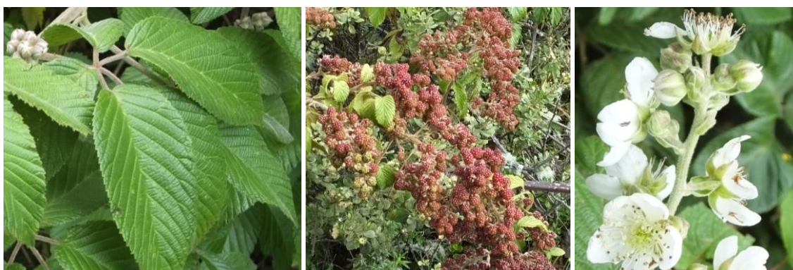
Figura 51. Planta. Morus rubustus .