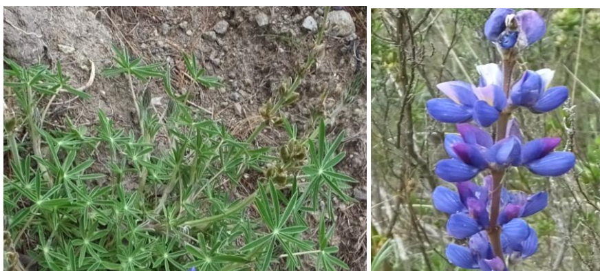
Figura 44. Planta: Lupinus sp.

Precauciones. En exceso puede matar a los animales menores.