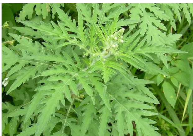
Figura 30. Planta: Ambrosia peruviana .