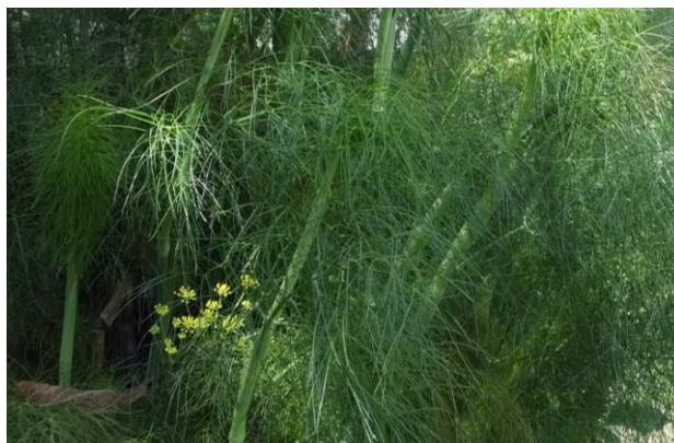
Figura 15. Planta: Foeniculum vulgare .