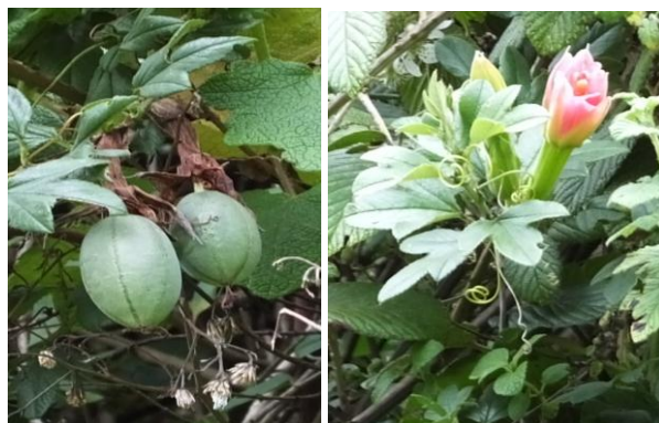
Figura 64. Planta: Passiflora sp.

Precauciones. Los niños menores de dos años no deben coger las flores ya que llora permanentemente durante el día.