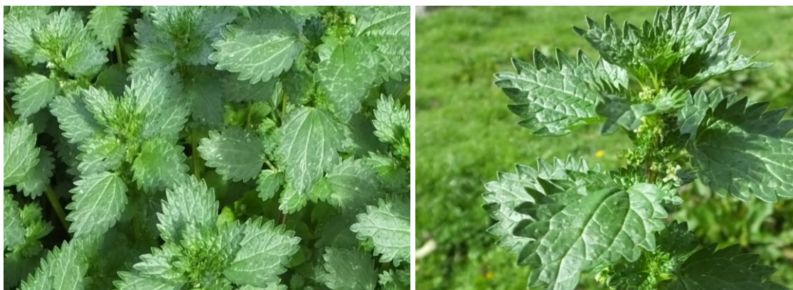
Figura 25. Planta: Urtica echinata .

Precauciones. En exceso puede causar alergias y no tener cura.