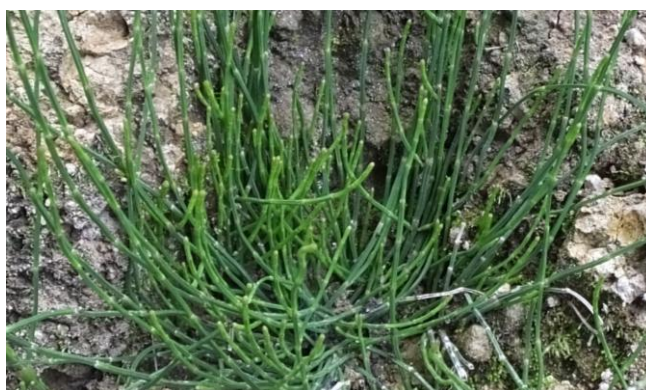
Figura 29. Planta: Equisetum bogotense .