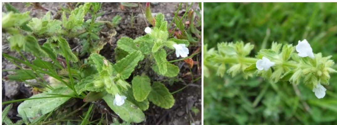
Figura 27. Planta: Stachis petiolosa .