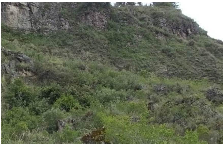
Figura 3. Vista del cerro Mesapata.