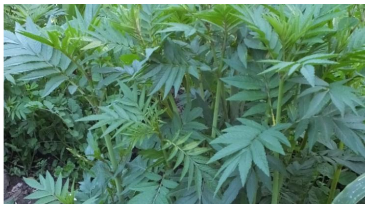
Figura 12. Planta: Tagetes minuta .