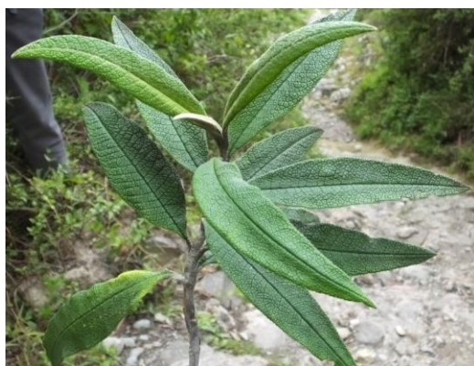
Figura 75. Planta: Buddleja sp.

Precauciones. Para ello debe ser bien arreglado por un amarrador, porque el remedio lo endurece tal como está.