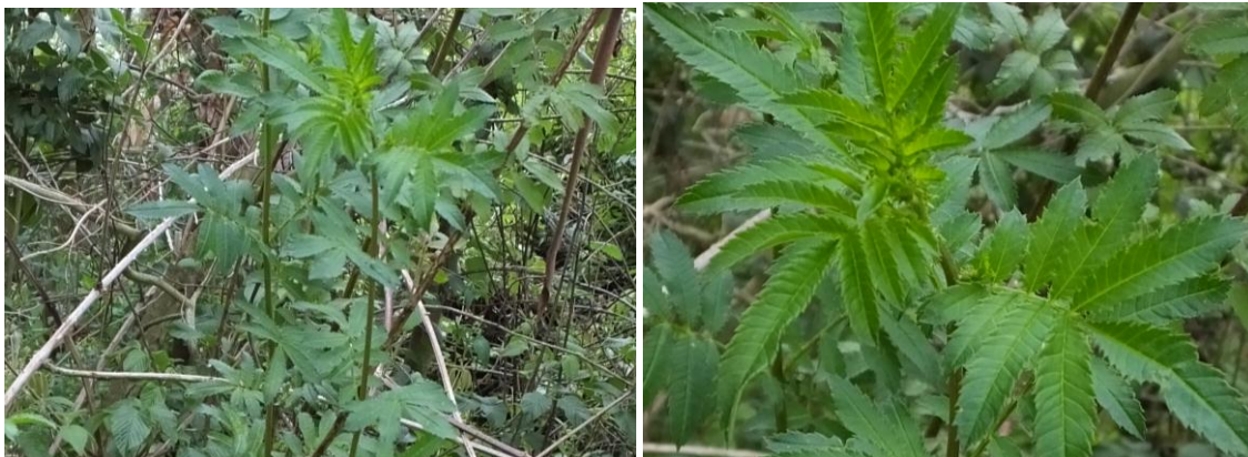
Figura 13. Planta: Tagetes elliptica .