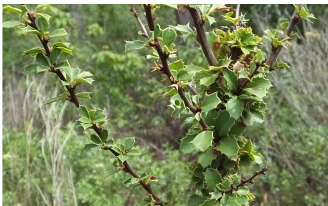
Figura 53. Planta: Berberis lutea .

Precauciones. Se debe recoger con guantes porque tiene espinas, caso contrario puede formarse pus en las manos cuando es afectado.