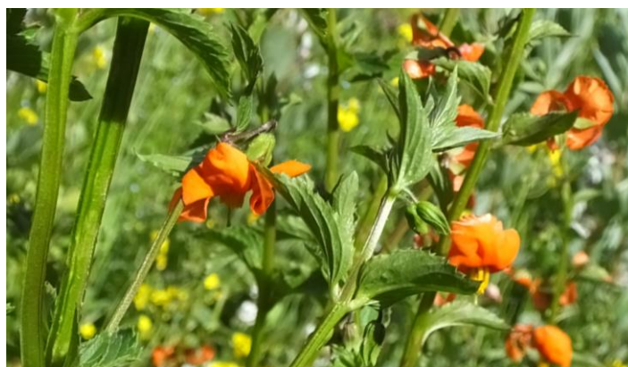
Figura 24. Planta: Alonsoa meridionales .