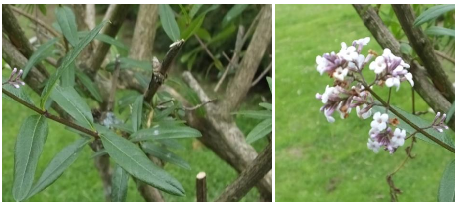
Figura 16. Planta: Aloisia triphylla .