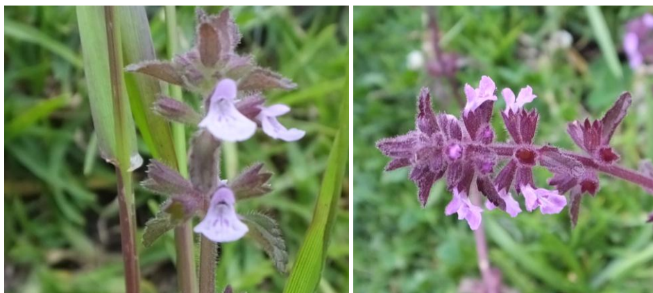
Figura 28. Planta: Stachis sp.