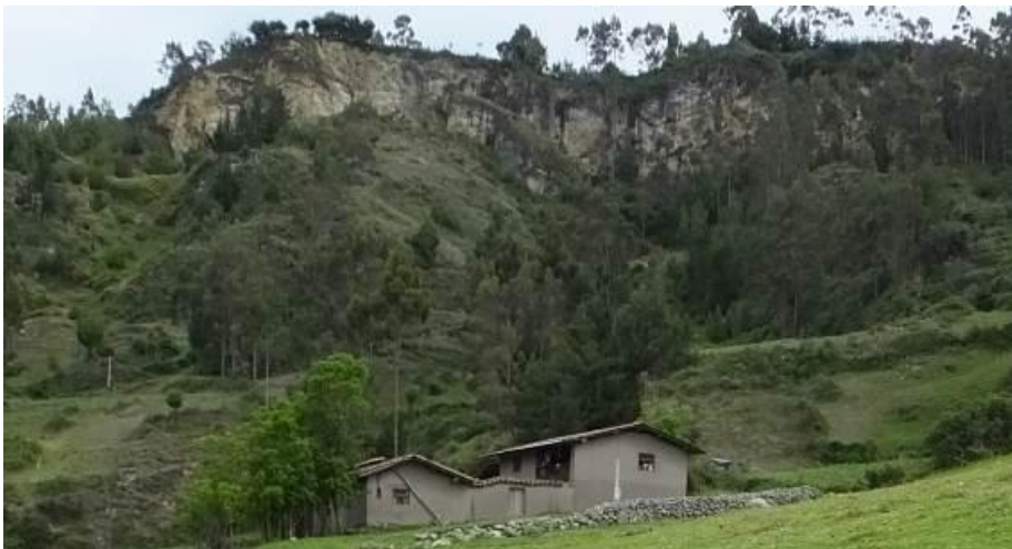
Figura 2. Vista del cerro Chilincaga