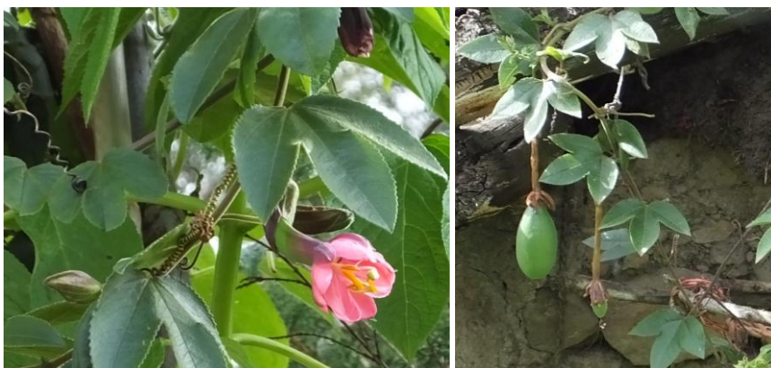
Figura 17. Planta: Passiflora mollisima .

Precauciones. Si se pone muy caliente la hoja en la parte afectada puede sancochar al cuerpo.