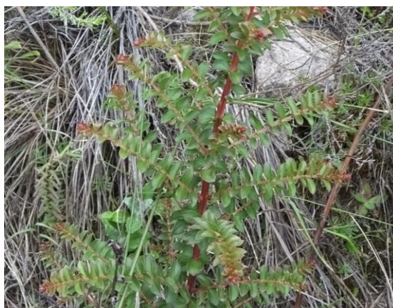
Figura 52. Planta: Coriaria ruscifolia .

Precauciones. Se debe saber los procedimientos necesarios caso contrario puede cambiar el color esperado.