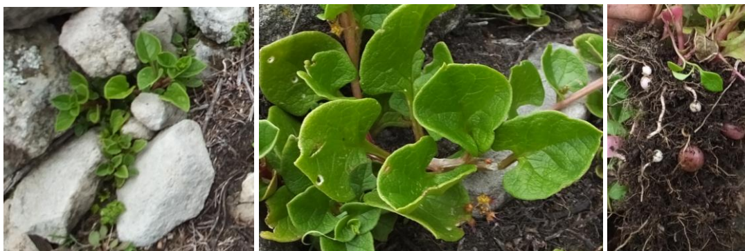
Figura 66. Planta: Ollucus sp.