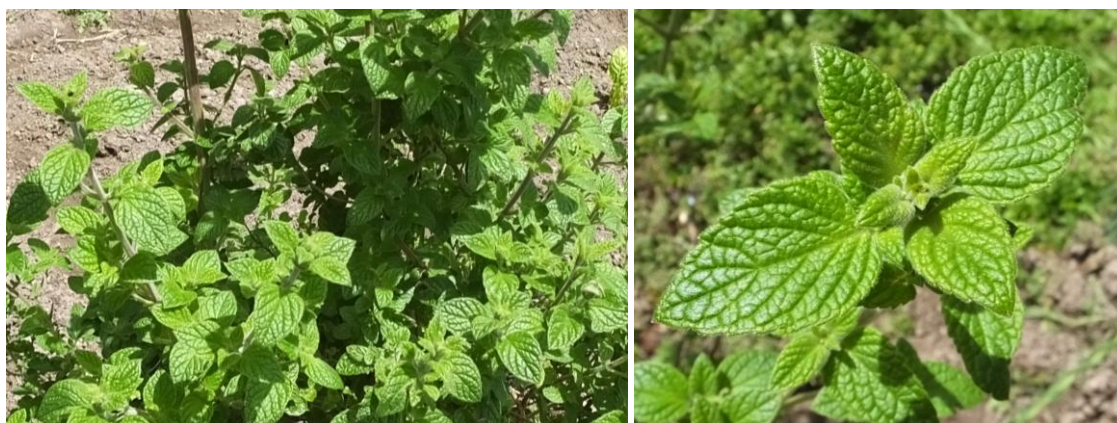
Figura 7. Planta: Minthostachys mollis .

Precauciones. En exceso puede sancochar al corazón.