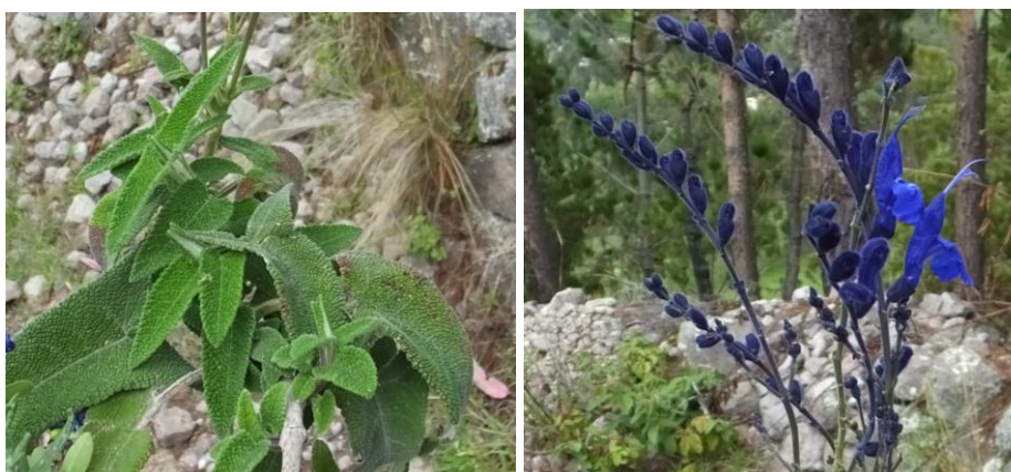
Figura 48. Planta. Salvia sagittata .