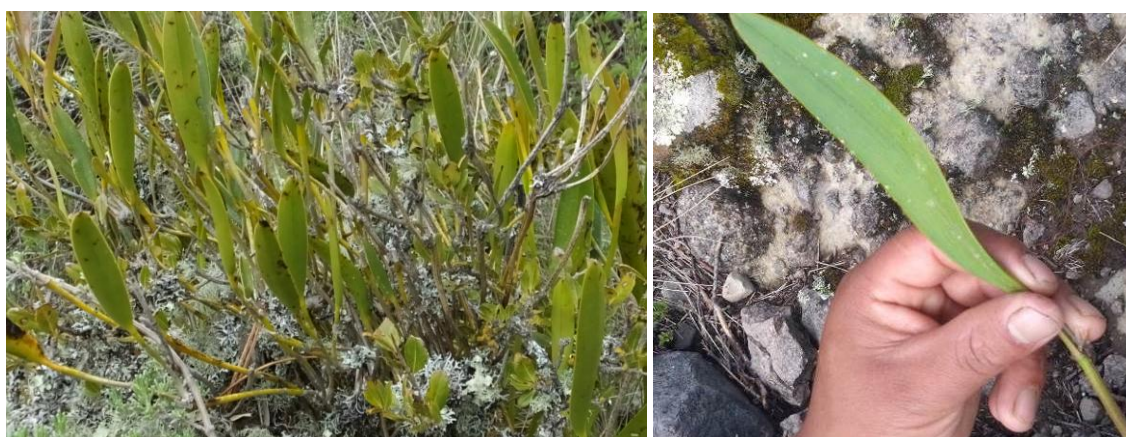
Figura 37. Planta: Stelis sp.