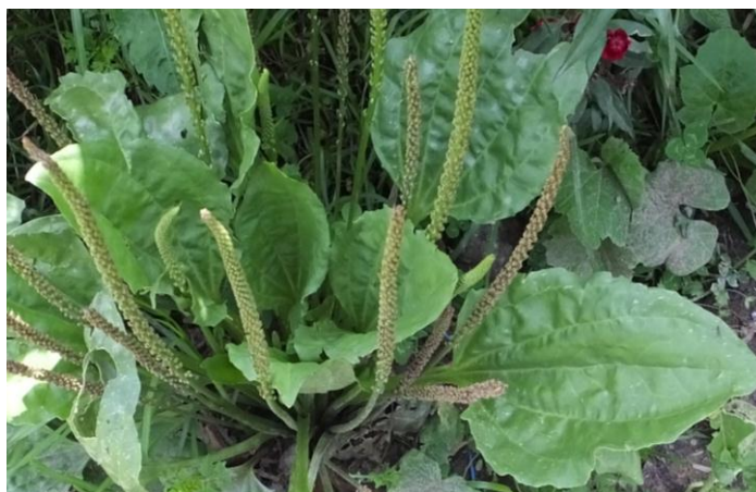
Figura 14. Planta: Plantago major .