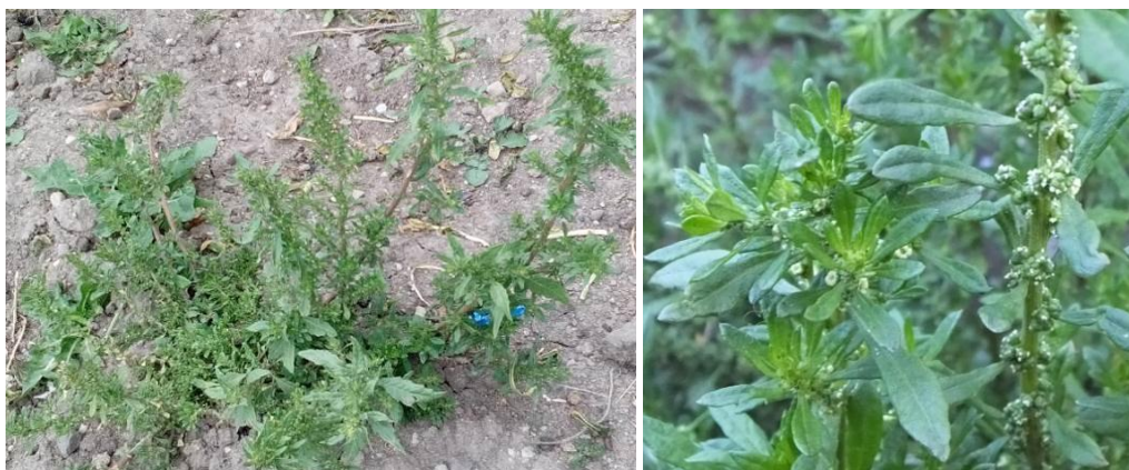
Figura 5. Chenopodium ambrosioides .

Precauciones. Durante el tratamiento no debe consumirse ají, para que haga efecto.