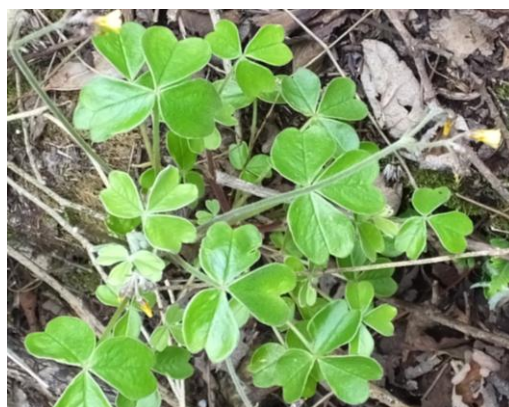
Figura 65. Planta: Oxalis sp.