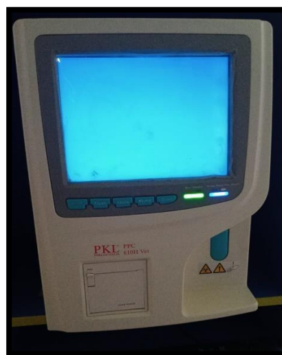
Imagen 2: Equipo hematológico de veterinaria PKL (POKLER ITALIA) PPC – 610HVet