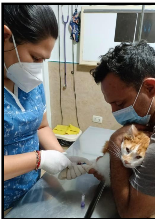
Imagen 4: Extracción de la muestra sanguínea al gato doméstico clínicamente sano.