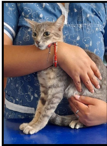
Imagen 1: Gato doméstico clínicamente sano.

Imágenes de la realización del trabajo de investigación hematológica de los gatos domésticos en el Distrito 26 de Octubre – Piura