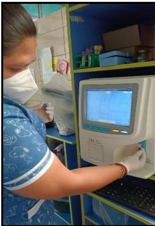
Imagen 5: Procesamiento de la muestra sanguínea en el equipo de automatizado.