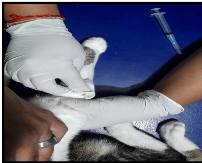
Imagen 3: Desinfección de la zona para la venopunción.