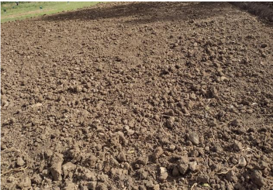
Preparación del campo experimental