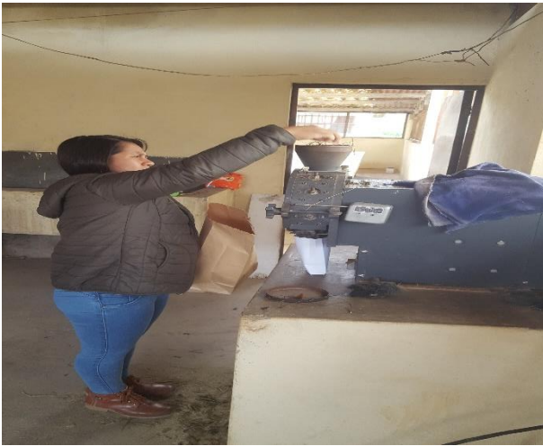
Molienda de muestras