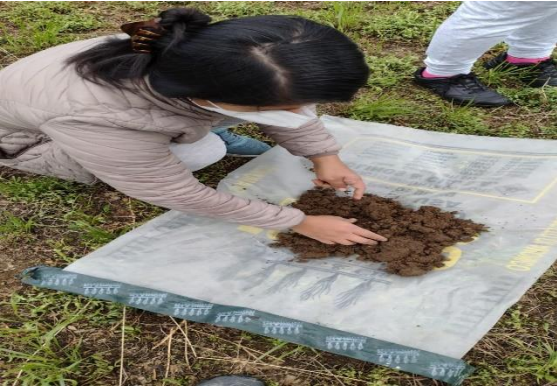
Mezcla de la submuestras para análisis De suelo del campo experimental.