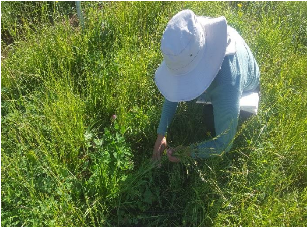
Altura de planta