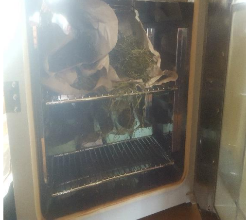
muestras de materia seca