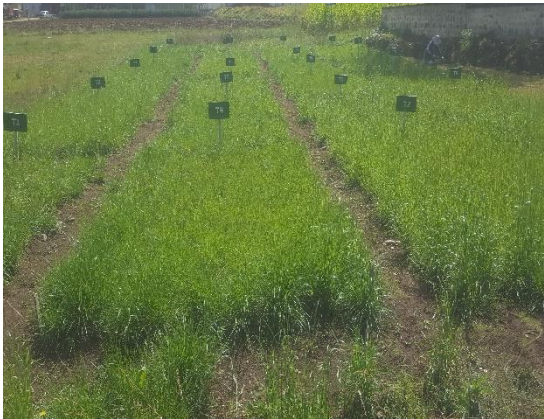
parcelas del campo experimental