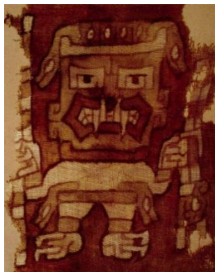
Dios de los báculos.

Los atributos utilizados en la iconografía de las culturas precolombinas están tomados principalmente de tres tipos de animales: los felinos, las aves y las serpientes. De los primeros se tomó los colmillos, de las aves los picos y las garras, y de las serpientes se tomaron sus formas corporales. Es notable la caracterización de atributos de poder en las representaciones en piedra, cerámica o textiles de partes de animales considerados sagrados por el alcance metafísico que de ellos podían tomarse. Podemos apreciar las garras del águila harpía, los colmillos del jaguar y una cabellera de serpientes en seres mitológicos considerados como deidades arquetípicas llenas de una simbología que debía estar al alcance de los sacerdotes – guías de estos pueblos, porque la regencia de los centros de poder en los Andes reunían las dotes de Rey, Sacerdote y Médico.