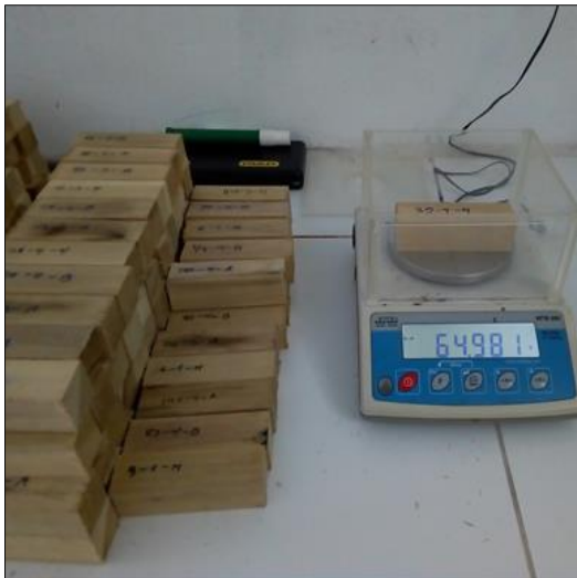
Foto 15. Pesado de probetas