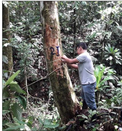
Foto 4. Medición del CAP