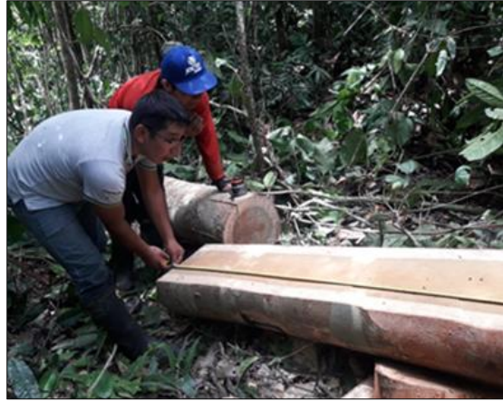
Foto 8. Medida de trozas