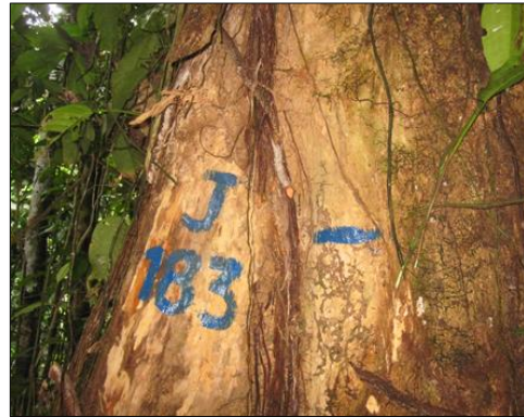
Foto 2. Codificación de los árboles