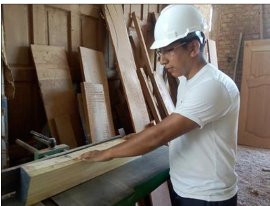
Foto 11. Procesamiento para las probetas