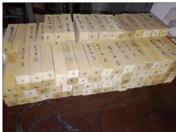
Foto 12. Probetas codificadas