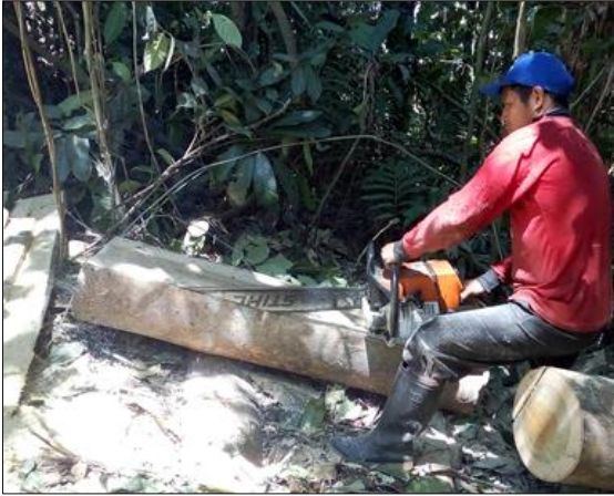
Foto 7. Aserrado de las trozas