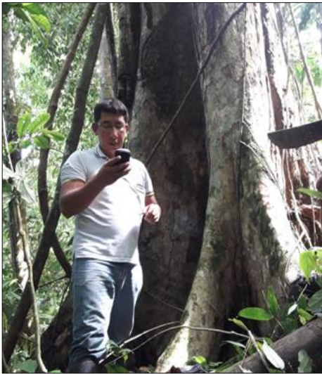
Foto 3. Georreferenciación con GPS