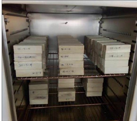
Foto 14. Probetas acondicionadas en la estufa