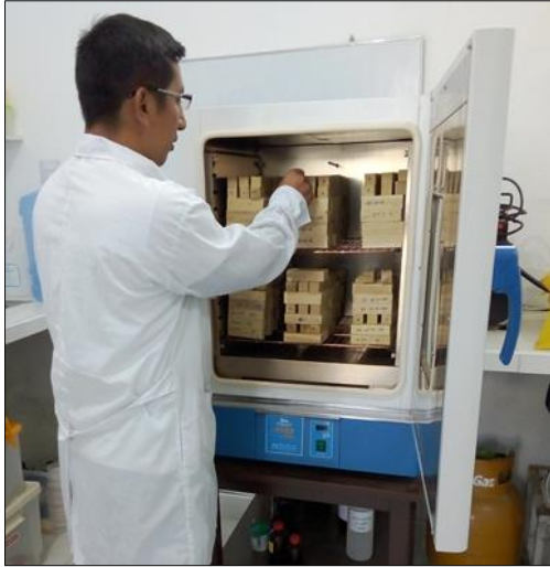
Foto 13. Secado de probetas