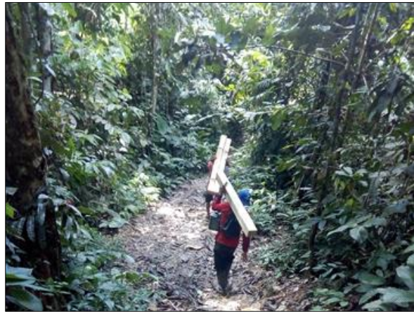
Foto 10. Traslado de los tablonces