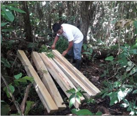
Foto 9. Obtención de tablonces