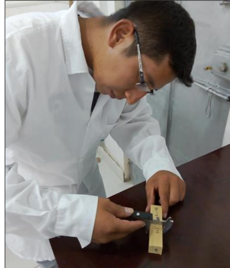
Foto 16. Medida de probetas