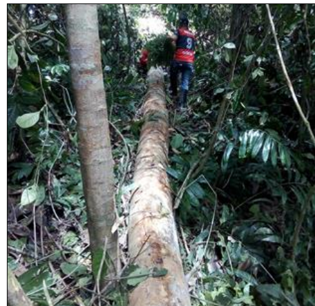
Foto 6. Desramado del fuste