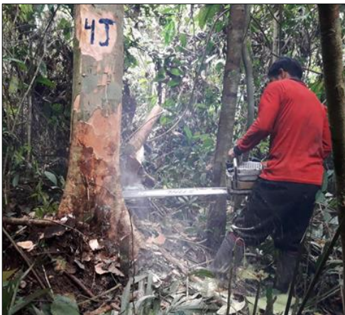
Foto 5. Apeado de los árboles