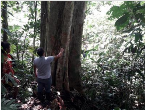
Foto 1. Reconocimiento de la especie