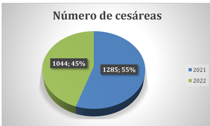
Gráfico 1: Número de cesáreas en el Hospital Regional Docente de Cajamarca en los años 2021 y 2022